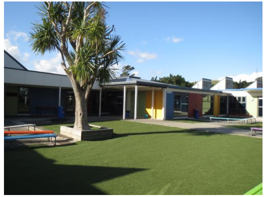
Pausenhof des Newlands College, Wellington